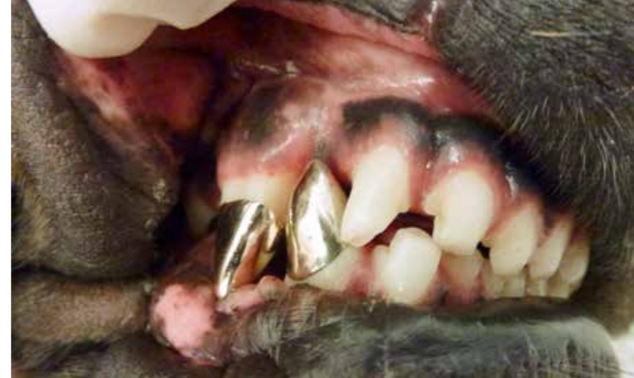
Metalkroner på slidte hjørnetænder. Denne hund havde ved leg med bold slidt sine hjørnetænder langt ned. Ved at rodbehandle tænderne og sætte metalkroner på, kunne tænderne bevares, og hunden kunne fortsætte sin elskede boldleg uden at skade tænderne.