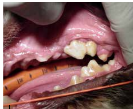
Den store rovtand i overkæben er kunstig. Det er en metal/keramikkrone, der sidder på fire implantat-skruer i kæben. Tandens holdt fint i de 10 år, patienten levede, efter at kronen blev sat i munden. Her er der ikke tale om tandbevarende behandling, men reetablering af en tabt, vigtig tand.