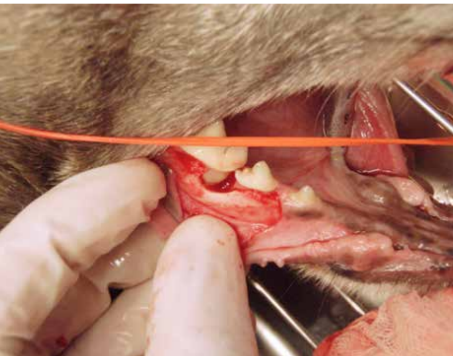
Ved hjælp af sonde og tandrøntgen fandt vi en stor defekt mellem to tænder, der ellers umiddelbart så sunde ud. Førhen ville de være blevet opereret ud, men her kunne vi bevare tænderne ved at rense grundigt op i defekten og fylde op med kunstig knogle, hvorefter tandkødet blev syet på igen. Hunden levede mange år efter operationen uden yderligere problemer i området.

er lige så vigtigt for dyr som for mennesker. Læg f.eks. mærke til, om hunden har humørsvingninger eller pludselig virker irriteret eller træt. Det kan være et tegn på, at tænderne gør ondt. Jeg anbefaler derfor mindst et årligt tandtjek hos dyrlægen.