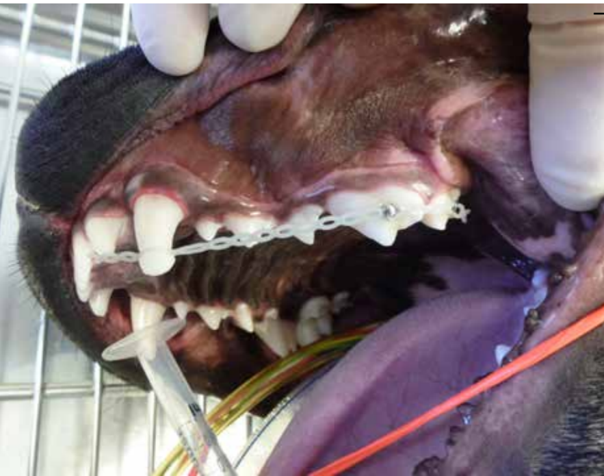
Hunde med fejlbid får oftere reguleret deres tænder nu til dags. Tidligere blev tænder, der sad forkert og var til gene, opereret ud. Dette er en hund med en elastik, som trækker hjørnetanden tilbage. Dette gøres, for at underkæbens hjørnetand kan få plads til at komme ud til siden og sidde fri af ganen.